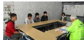
昨年の受入れ風景

長岡京市の中学校では市内の事業所の職場体験をするカリキュラムがあります。我がサポセンにも11月6日（水）～8日（金）に長岡第三中学校の2年生3名が体験学習で来てくれます。