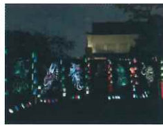
勝竜寺城公園にて